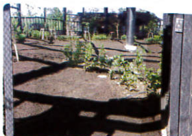
植生基盤に自然由来フルボ(腐植)を混合

2013年4月にオープン予定の「トキふれあいセンター(佐渡)」にて自然由来腐植が活用されています。