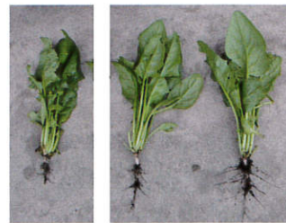
バーク堆肥 自然由来フルボ(腐植)