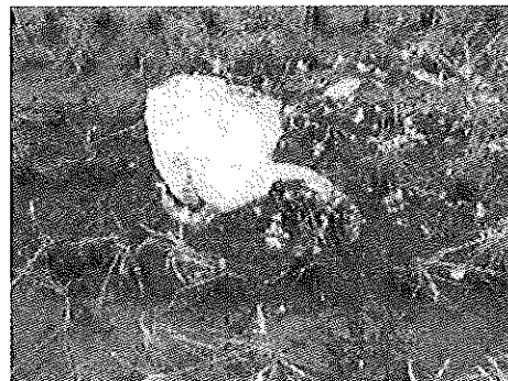
落下衝撃で田に埋没、頭部は左斜め下の穴跡に。