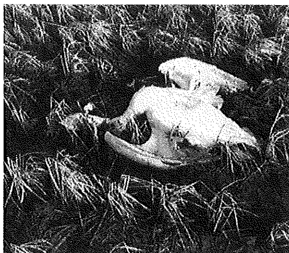
隣には幼長も即死。