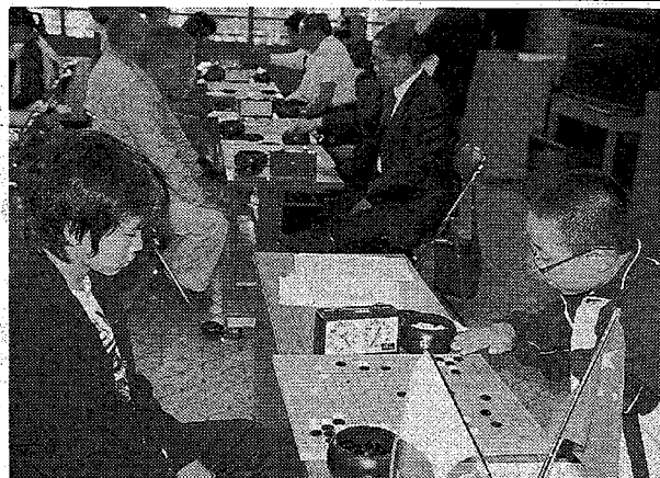
囲碁で交流を深める柏、承徳の両市民ら＝柏市で

パネルディスカッションには、堂本曉子知事や環境問題に詳しい東京情報大のケビン・シヨート教授、県内の林業関係者らが出席。