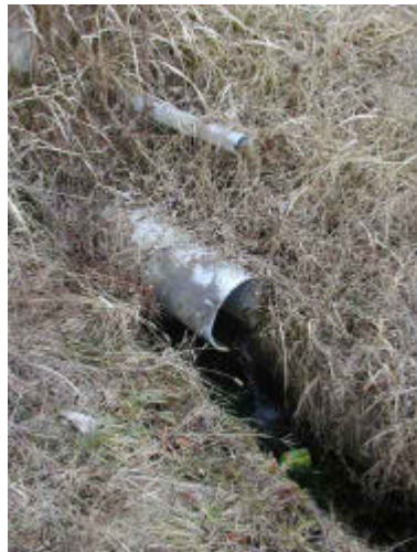
水は左の斜面林からも